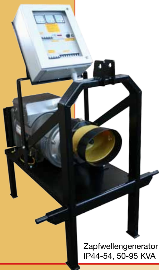
Zapfwellengenerator IP44-54, 50-95 KVA