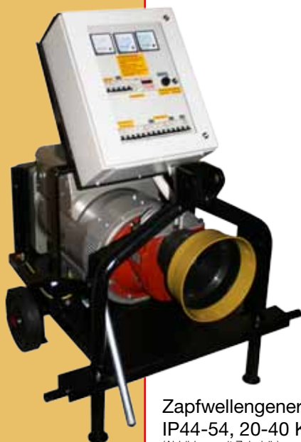
Zapfwellengenerator IP44-54, 20-40 KVA (Abbildung mit Zubehör)