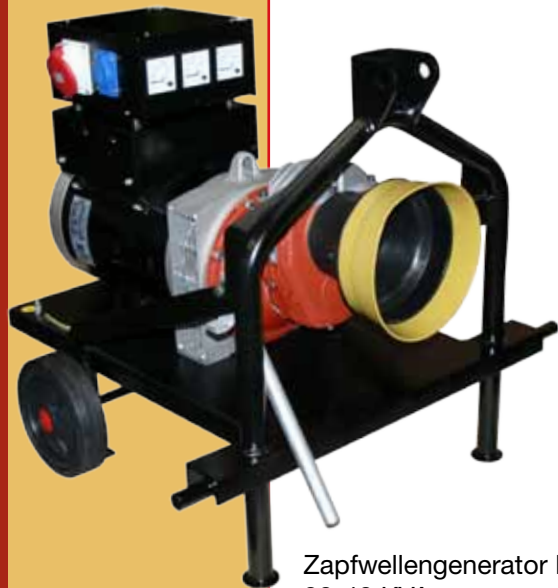
Zapfwellengenerator IP23 20-40 KVA